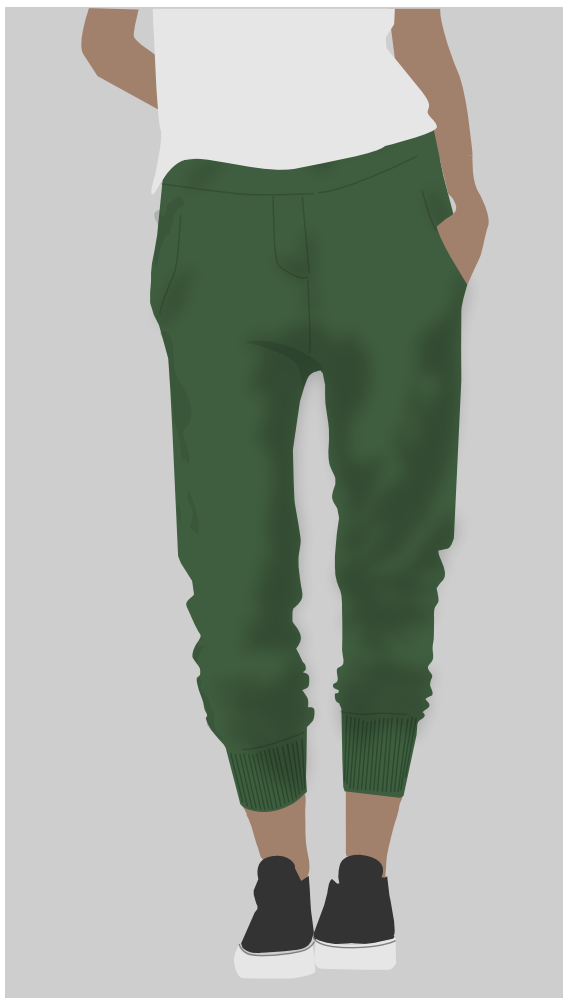
» Calças moletom jogger verde escuro